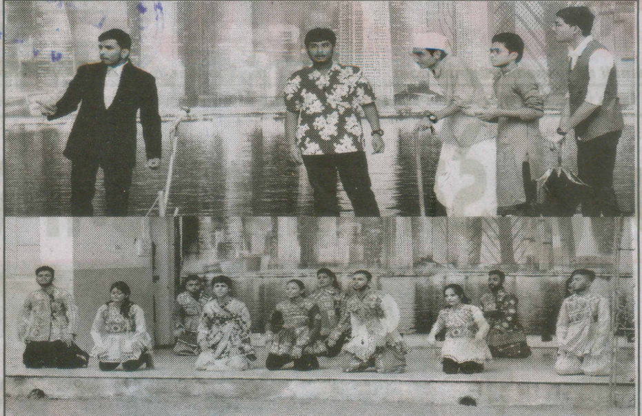
સેમકોમ કોલેજ ખાતે તથા વર્ષમાં પ્રવેશ પામેલ વિદ્યાર્થીઓનું અભિમુક્તા કાર્યક્રમ તથા સાંસ્કૃતિક કાર્યક્રમ રજૂ કરતા વિદ્યાર્થીઓ

(પ્રતિનિધિ) આણંદ, તા. ૨૯ સેમકોમ કોલેજ વિદ્યાનગર દ્વારા પ્રથમ વર્ષમાં પ્રવેશ પામેલ વિદ્યાર્થીઓ માટે અભિમુક્તા કાર્યક્રમ યોજવામાં આવ્યો. જેમાં બી.કોમ, બી.બી.એ., બી.સી.એ. અને બી.બી.એ (આઈટીએમ)માં પ્રથમ વર્ષમાં પ્રવેશ મેળવેલ વિદ્યાર્થીઓને સેમકોમ, યાત્રાતર વિદ્યા મંડળ અને વલ્લભ વિદ્યાનગરના ઈતિહાસ અને વિશિષ્ટતાઓથી માહિતગાર કરાયા. કોલેજના પ્રાધ્યાપકોએ વિદ્યાર્થીઓને સેમકોમની વિશિષ્ટ કામગીરીમાં કઈ રીતે ગોઠવાઈ જવું તે રીતે પ્રોત્સાહીત કર્યા. વિદ્યાર્થીઓને અમુલની મુલાકાતે લઈ જવામાં આવ્યા હતા. કાર્યક્રમના બીજા દિવસે